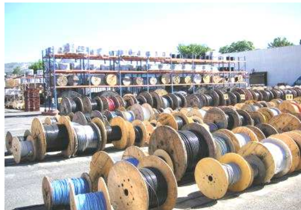
PÔLE LOGISTIQUE AUBAGNE - PARC A TOURETS